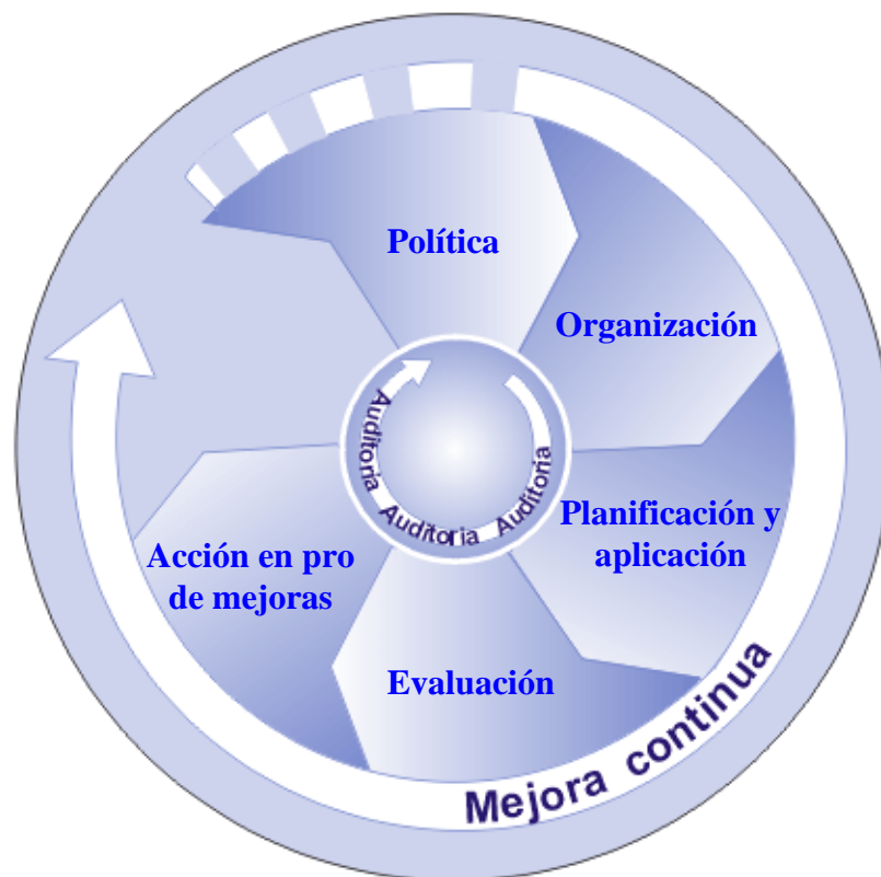
Gráfico 2. Principales elementos del sistema de gestión de la seguridad y la salud en el trabajo

La seguridad y la salud en el trabajo, incluyendo el cumplimiento de los requerimientos de la SST conforme a las leyes y reglamentaciones nacionales, son la responsabilidad y el deber del empleador. El empleador debería mostrar un liderazgo y compromiso firme con respecto a las actividades de SST en la organización , y debería adoptar las disposiciones necesarias para crear un sistema de gestión de la SST, que incluya los principales elementos de política, organización, planificación y aplicación, evaluación y acción en pro de mejoras, tal como se muestra en el gráfico 2.